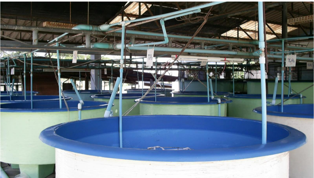
ภาพผนวกที่ 2 ถังไฟเบอร์กลาสระบบน้ำหมุนเวียน ที่ใช้ในการทดลองผลิตลูกปลานิลแปลงเพศ ที่ระดับความหนาแน่นแตกต่างกัน 4 ระดับ เป็นเวลา 21 วัน