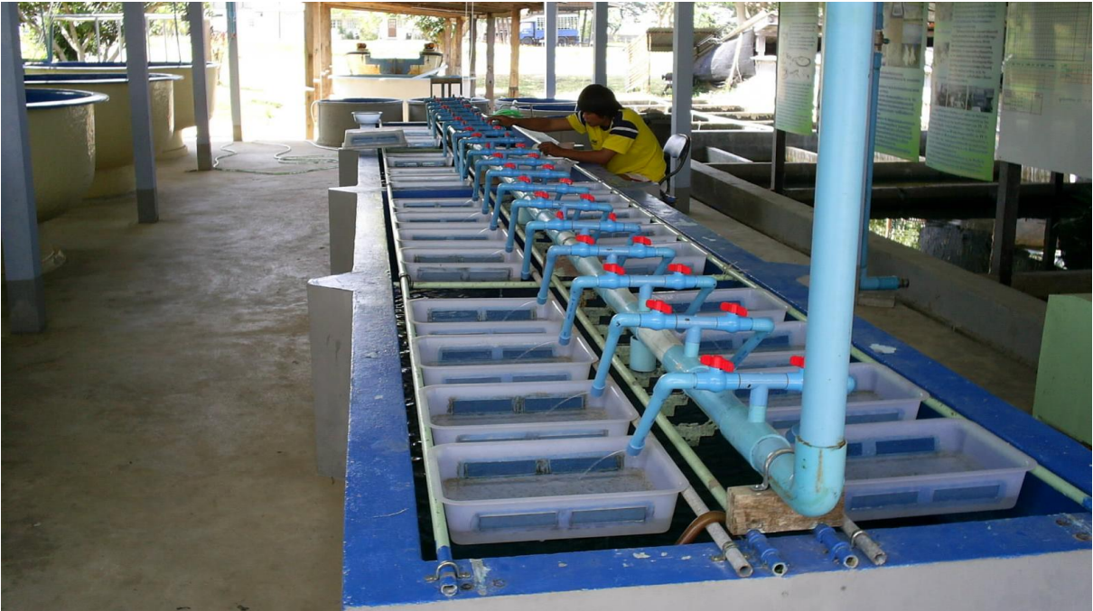
ภาพผนวกที่ 1 ระบบฟักไข่ปลานิล ที่ใช้ในการทดลองผลิตลูกปลานิลแปลงเพศในถังไฟเบอร์กลาส ระบบน้ำหมุนเวียน ที่ระดับความหนาแน่นแตกต่างกัน 4 ระดับ เป็นเวลา 21 วัน