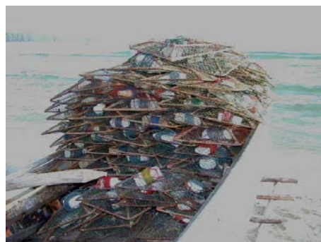
จันหอยหวาน