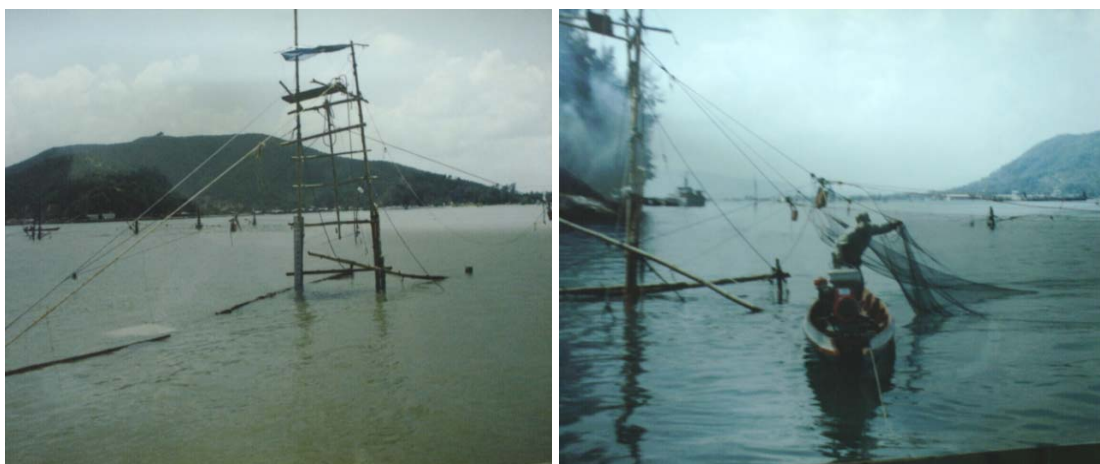
บาม และวิถีทำการประมง

สัตว์น้ำที่จับได้ ส่วนมากเป็นปลากระบอก และปลากระทุงเหว