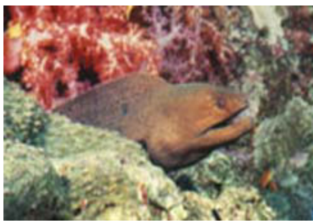
ปลาไหลมอเรย์ยักษ์ Giant moray ( Gymnothorax javanicus )