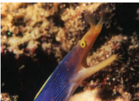
ปลาไหลมอเรย์ตัวแบน Ribbon eel Greyface moray ( Rhinomuraena quesita )

ปลาไหลมอเรย์ ถือเป็นผู้ควบคุมปริมาณสิ่งมีชีวิตในแนวปะการังโดยมักพบตามหลืบซอกของโครงสร้างปะการัง ถ้าบริเวณใดไม่พบปลาไหลมอเรย์เลยแสดงว่าความหลากหลายของสิ่งมีชีวิตในบริเวณนั้นต่ำโดยเฉพาะกุ้ง ปู