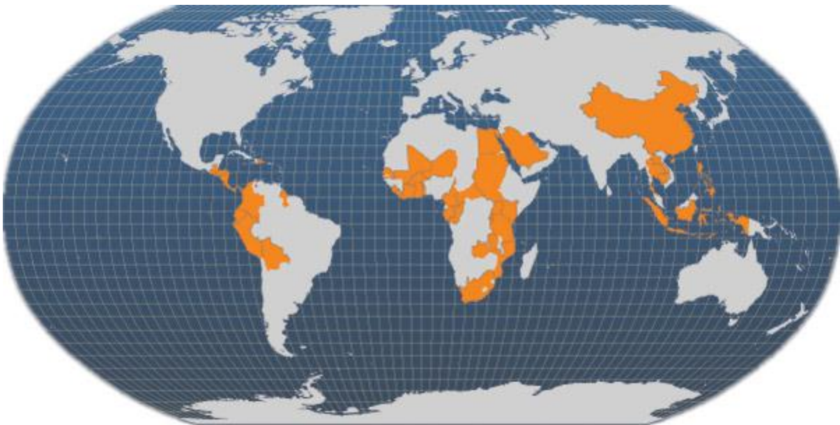
รูปที่ 1 ประเทศหลักที่ผลิตปลานิลในโลก

การเพาะเลี้ยงปลานิลนั้นมีการเพาะเลี้ยงมายาวนานและได้มีการเพาะเลี้ยงไปทั่วโลก (รูปที่ 1) ในปี พ.ศ. 2549 มีผลผลิตของปลานิลจำนวน 1,988,726 ตัน ประเทศจีนเป็นผู้นำทางด้านการผลิตปลานิลในระดับโลก โดยมีผลผลิตประมาณจำนวนมากกว่าครึ่งของผลผลิตปลานิลทั่วโลกและยังคงผลิตได้อย่างสม่ำเสมอในทุกๆปี โดยตั้งแต่ปี 2535-2549 ผลผลิตปี 2549 ของประเทศจีนมีมากถึง 1,111,461 ตัน และประเทศอียิปต์มีรายงานผลผลิตได้ถึง 258,925 ตัน ในปีเดียวกัน