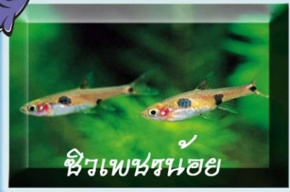
ซิวเพชรน้อย

ชื่อวิทยาศาสตร์ MICRORASBORA KUBOTAI ลักษณะเด่น ตัวโต เกือบตัวเล็กเงินขาวอมเหลืองอ่อน etail เหลืองเขียวอ่อนค่อนข้างใส ครีบใส อาหาร แพลงก์ตอนสัตว์ ถิ่นอาศัย ภาคใต้ถึงอินทนนท์บริเวณ ถึงหัวตมฟ้าบุรี พังงา ระนอง ขนาด 2-3 เซนติเมตร