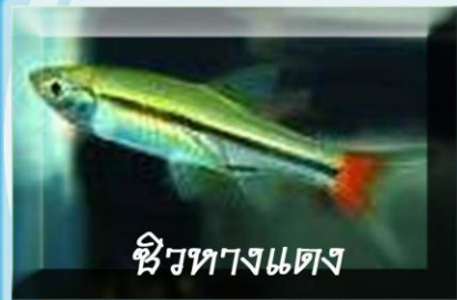
ซิวหางแดง

ชื่อวิทยาศาสตร์ BORARAS MACULATA ลักษณะเด่น ลำตัวมีจุดดำขนาดใหญ่ 2 จุด โคนหางมีจุดเล็ก 1 จุด ครีบมีสีแดงใส อาหาร แพลงก์ตอนสัตว์ ถิ่นอาศัย พรุโต๊ะแดง ถึงหัวตมฟ้าบุรี ขนาด 3 เซนติเมตร