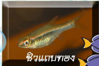
ซิวแถบทอง

ชื่อวิทยาศาสตร์ RASBORA DORSICELLATA ลักษณะเด่น ลำตัวสีข้างของและหางอันแดง มีจุดสีที่ปลายครีบหาง อาหาร แพลงก์ตอนสัตว์และตัวอ่อนแมลง ถิ่นอาศัย พรุโต๊ะแดง ถึงหัวตมฟ้าบุรี ขนาด 3 เซนติเมตร