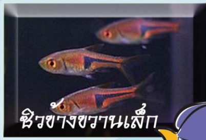
ซิวข้างขวานเล็ก

หลายคนคงเคยได้ยินคำว่าปลาซิวว่า "ใสสะอาดเหมือนปลาซิว" เพราะเป็นปลาขนาดเล็กที่ตายง่าย ไม่สามารถทนสภาพที่ขาดน้ำได้เป็นเวลานาน พบได้ทั่วไปทุกภาคของประเทศไทย จัดเป็นปลาอยู่ใน FAMILY CYPRINIDAE / SUBFAMILY DANIONINAE ปลาซิวเป็นปลาที่มีความสำคัญในห่วงโซ่อาหารในแหล่งน้ำ โดยเป็นอาหารของสิ่งที่มีชีวิตที่มีขนาดใหญ่กว่า และเป็นปลาที่กินแมลงน้ำเป็นอาหาร มีลักษณะสีส้มคล้ายงา โดยเฉพาะเมื่ออยู่รวมกันเป็นฝูง ในปัจจุบันมีการรวบรวมพันธุ์ปลาจากแหล่งน้ำธรรมชาติ เพื่อจำหน่ายเป็นปลาสวยงามทั้งในและต่างประเทศ ส่วนการเพาะเลี้ยงนั้นยังมีอยู่น้อย ถึงแม้ว่าเป็นปลาที่มีความสำคัญทางเศรษฐกิจและมีความสำคัญต่อระบบนิเวศของแหล่งน้ำอีกชนิดหนึ่ง