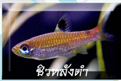
ซิวหลังดำ

ชื่อวิทยาศาสตร์ Boraras urophthalmoides ลักษณะเด่น ครีบใหญ่ ครีบกันขนาดใหญ่ หางมีสีแดง มีแถบยาวค่อนลำตัว มีจุดสีฟ้าที่โคนหาง อาหาร แพลงก์ตอนสัตว์ และตัวอ่อนแมลง ถิ่นอาศัย พรุโต๊ะแดง ถึงหัวตมฟ้าบุรี ขนาด 1.5-2 เซนติเมตร