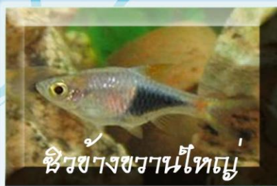
ซิวข้างขวานใหญ่

ชื่อวิทยาศาสตร์ RASBORA BORAPETENSIS ลักษณะเด่น ลำตัวสีเหลืองอ่อน มีแถบสีฟ้าพาดยาวตลอดลำตัวและมีแถบสีทองขนาดค่อนบน โคนครีบหางสีแดงสด อาหาร แพลงก์ตอน สัตว์ ถิ่นอาศัย พบทั่วไปในแหล่งน้ำในภาคใต้ไทย ขนาด 5 เซนติเมตร