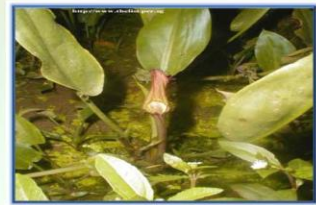
ใบพายน้ำ

ชื่อวิทยาศาสตร์ Cryptocoryne balansae ชื่อสามัญ Crypt ลักษณะเด่น เป็นรูปหัวใจขอบขาว ปลายใบแหลม มีสีเขียวเข้มถึงเขียวเข้ม มีริ้วขอบใบเป็นคลื่นดูเด่นชัด ดอกเป็นช่อสีขาว แหล่งที่พบ ที่สูงบริเวณน้ำตกหรือลำธารที่น้ำไหล