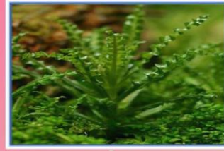
ดาวมัจฉา

ชื่อวิทยาศาสตร์ Barclaya longifolia Wall. ชื่อสามัญ Orchid Lily ลักษณะเด่น มีทั้งขนาดเล็กหรือใหญ่ ใบรูปไข่แกมรูปหอก ก้านใบยาวออกจากลำต้นเป็นวงในเป็นพุ่มหรือช่อดูประหลาด ด้านบนใบสีเขียวหรือเขียวอมฟ้า ด้านล่างสีม่วงในบางชนิด เติบโตในน้ำจืดหรือน้ำกร่อย ดอกมีสีม่วงแดง แหล่งที่พบ ลำธารที่ไหลเร็วอยู่ พื้นดินในบึงราย ในภาคตะวันออกเฉียงเหนือ