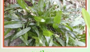
รากดำใบยาว

ชื่อวิทยาศาสตร์ Cryptocoryne cordata ชื่อสามัญ Crypt ลักษณะเด่น ลำต้นเป็นพุ่มสั้นๆ ใบรูปไข่แกมรูปหอก ก้านใบยาวออกจากลำต้นเป็นวงในเป็นพุ่มหรือช่อดูประหลาด ด้านบนใบสีเขียว ด้านล่างสีม่วงในบางชนิด เติบโตในน้ำจืดหรือน้ำกร่อย ดอกเป็นช่อสีขาว พบในบริเวณต้นน้ำลำธาร ปลายน้ำลำธาร แหล่งที่พบ บึงพุทราทางภาคใต้