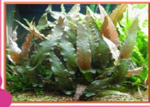
ไต้ป่าหยา

ชื่อวิทยาศาสตร์ Barclaya longifolia Wall. ชื่อสามัญ Orchid Lily ลักษณะเด่น มีทั้งขนาดเล็กหรือใหญ่ ใบรูปไข่แกมรูปหอก ก้านใบยาวออกจากลำต้นเป็นวงในเป็นพุ่มหรือช่อดูประหลาด ด้านบนใบสีเขียวหรือเขียวอมฟ้า ด้านล่างสีม่วงในบางชนิด เติบโตในน้ำจืดหรือน้ำกร่อย ดอกมีสีม่วงแดง แหล่งที่พบ ลำธารที่ไหลเร็วอยู่ พื้นดินในบึงราย ในภาคตะวันออกเฉียงเหนือ