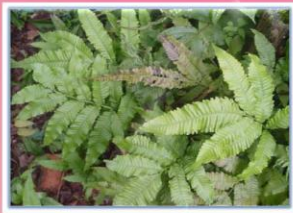
รากดำใหญ่

ชื่อวิทยาศาสตร์ Pogstemon helferi ชื่อสามัญ Downal ลักษณะเด่น ลำต้นเป็นพุ่มโปร่ง เจริญเติบโตเป็นกลุ่มกอใหญ่ ใบเล็กเป็นเส้น มีสีเขียวเข้มอ่อน เติบโตในน้ำจืดหรือน้ำกร่อย ลำต้นสูงประมาณ 1 นิ้ว - 1 นิ้วครึ่ง และสามารถเจริญเติบโตได้เร็ว แหล่งที่พบ กระจ่างเขตรักษาพันธุ์สัตว์ป่าห้วยขาแข้ง